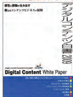
デジタルコンテンツ白書執筆