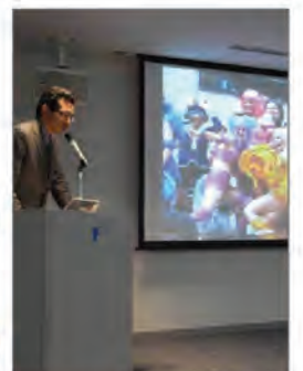
講演: 関西経済連合会 大阪-フランス