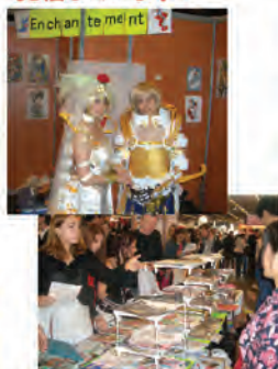
ジャパンエキスポ出展