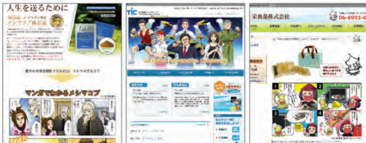
リスティングHP(健康食品)