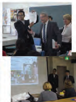
MANGA×日本語 日本語教材開発プロジェクト 大阪-フランス